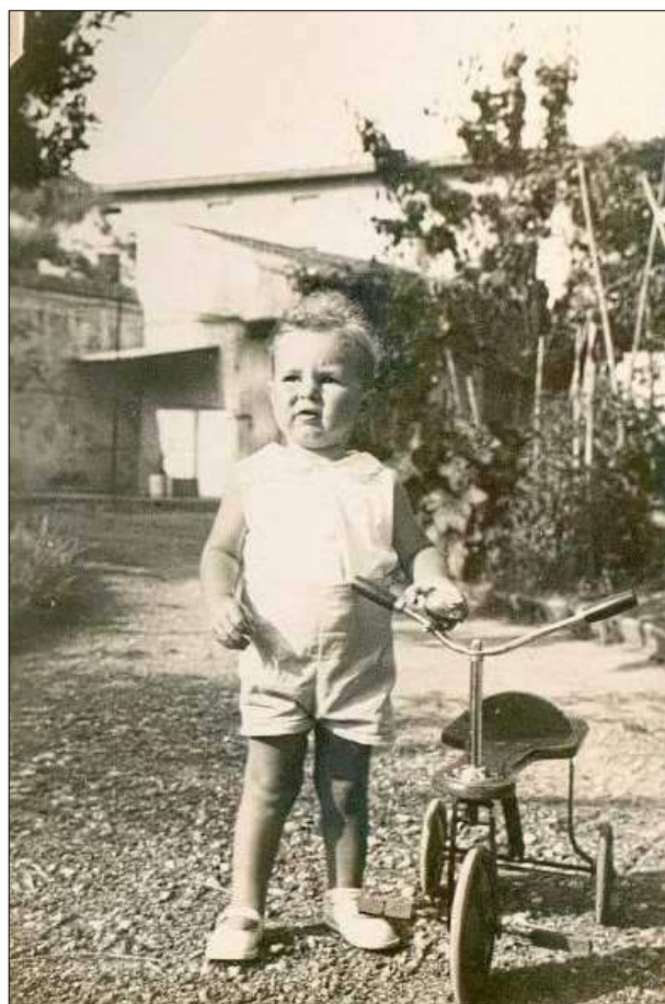
In giardino di villa Manaboni a giocare