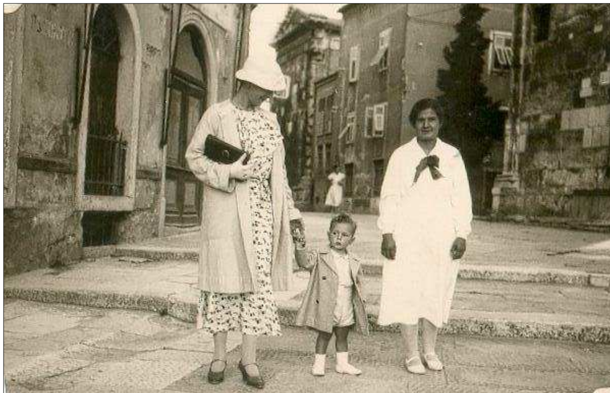
Pola nel giugno 1934 con Mamma e una Tata